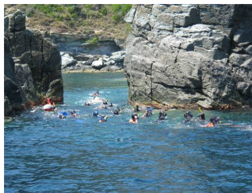
La randonnée palmée