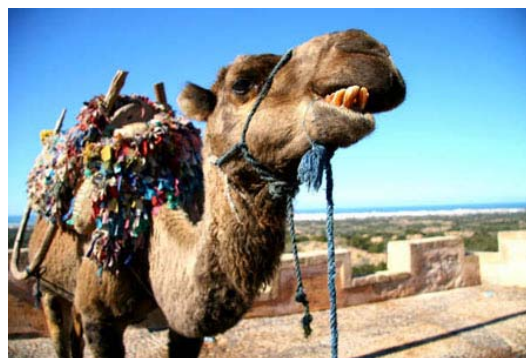
Un dromadaire prêt pour le bivouac