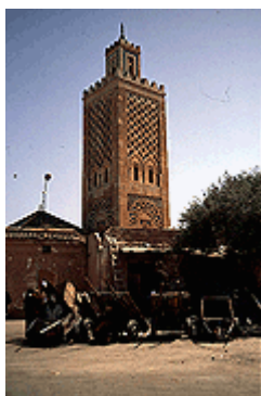
Les remparts et la Médina de Marrakech